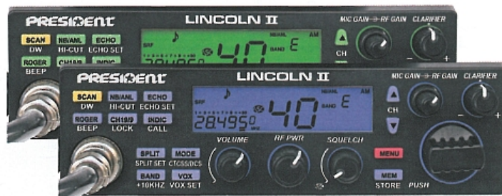
Wersje kolorystyczne podświetlenia